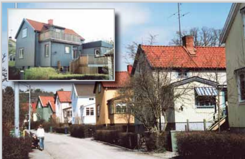
Norra Ängby. En grupp 1 1/2-planshus med de typiska ursprungliga verandorna. På lilla infällda bilden visas ett exempel på hur flera ändringar, kulör, fönstersättning, tillbyggnadsformer och räcken som inte hör hemma i denna byggnadstradition, medför att husets karaktärsdrag inte längre kan avläsas.

Det har visat sig att de tillbyggnadsalternativ som angavs i miljöprogrammet inte var tillräckliga för de boendes behov. Många har börjat med att förstora och förhöja verandan, därefter har vinkeln som blev kvar fylls ut med rumsyta och en entrétillbyggnad med plats för wc har placerats på lämpligt ställe. I ovanvåningarna har breda takkupor byggts för att inrymma badrum. När dessa åtgärder inte har räckt har man föreslagit tillbyggnader, fortfarande mot trädgården, men i nästan hela husets bredd. Dessa tillägg har oftast kunnat tillstyrkas även av kulturmiljövårdande myndighet.